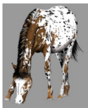
LE SUJET LA DEMANDE