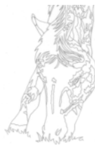
LE CALQUE LE COMMENCEMENT